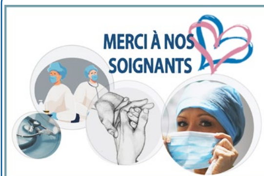
Illustration : Violina VASILEVA

Pour assurer le fonctionnement de cette équipe, 7 jours sur 7, une quinzaine de professionnels de santé ont été formés. L'équipe compte à ce jour 4 masseurs-kinésithérapeutes du CHSF épaulés par une dizaine de vacataires. Une ergothérapeute et une orthophoniste du CHSF se sont également portées volontaires. L'équipe intervient dans les tous les services de soins critiques COVID pour procéder au décubitus dorsal (de 10h à 16h) puis ventral (de 16h à 10h). Elle est également sollicitée pour des exercices de mobilisation passive, importants pour la récupération motrice et neurologique des patients. Mise en place par la Coordination Générale des Soins, cette équipe a pu être opérationnelle rapidement grâce à l'implication de Noémie PEREZ-SANCHEZ, cadre de Rééducation-Réadaptation. Un Médecin réanimateur et une infirmière de Réanimation ont assuré la formation préalable. La création de cette équipe a également été accompagnée par le Dr Didier LECOINTE, responsable de l'hygiène hospitalière.